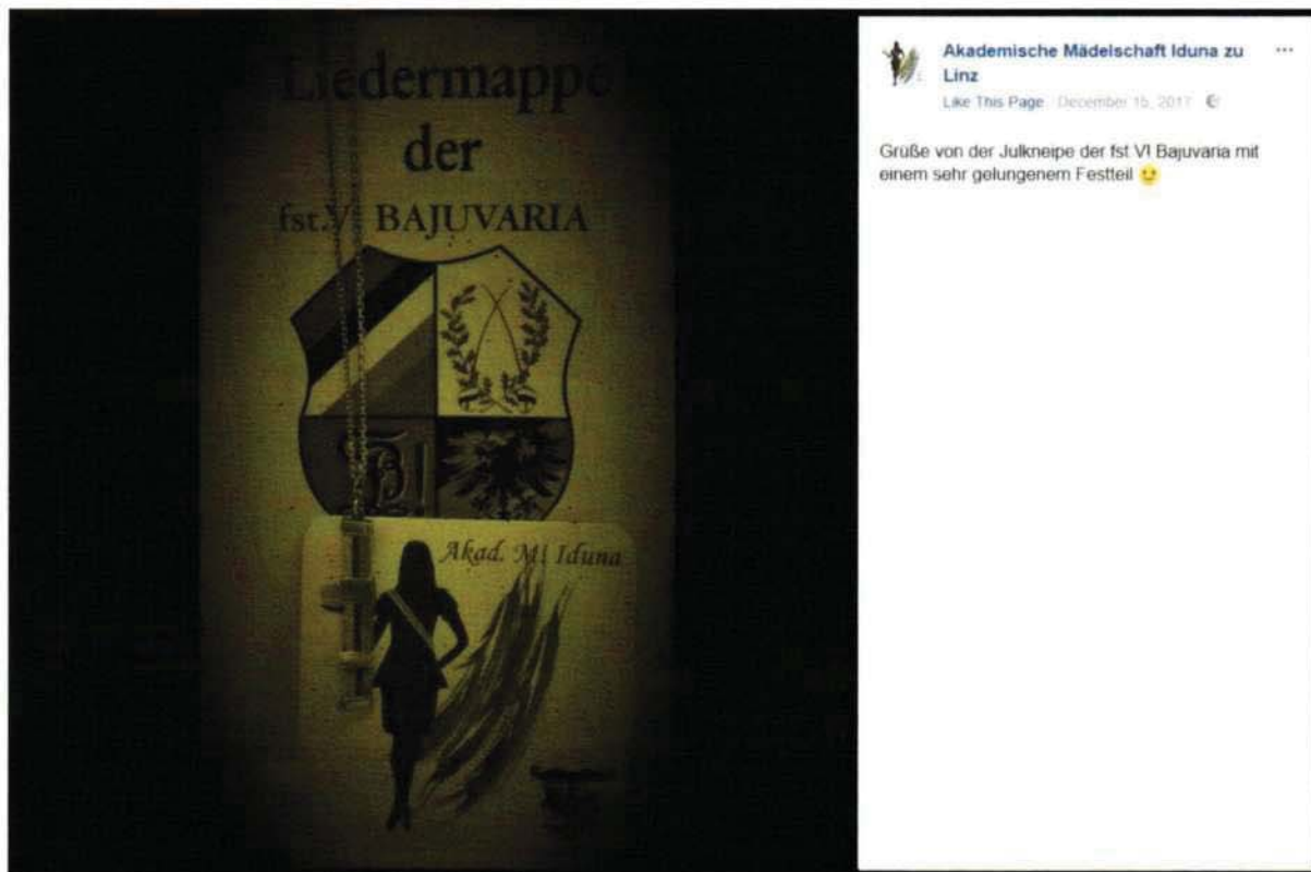
Abbildung 8 | Quelle:

https://www.facebook.com/iduna.linz/photos/a.631068920252352.1073741829.621014437924467/1979096238782940/?type=3&theater (abgerufen am 4.1.2018)