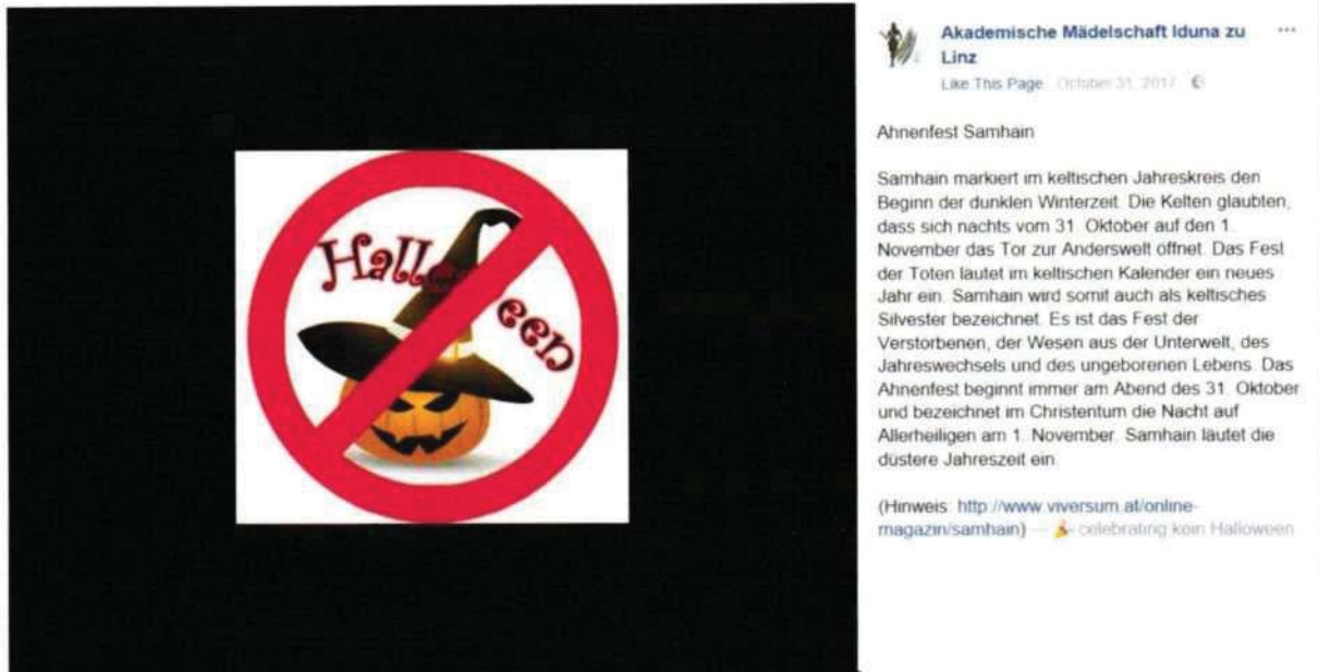
Abbildung 5 | Quelle:

https://www.facebook.com/iduna.linz/photos/a.631068920252352.1073741829.621014437924467/2163184610374101/?type=3&theater (abgerufen am 4.1.2018)