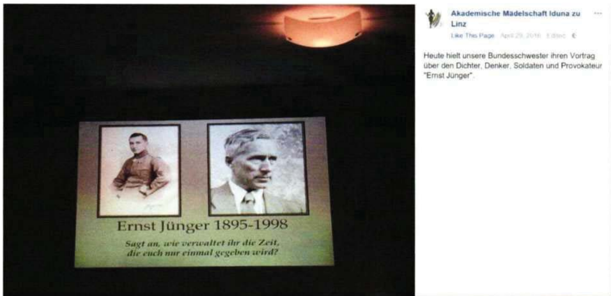
Abbildung 14