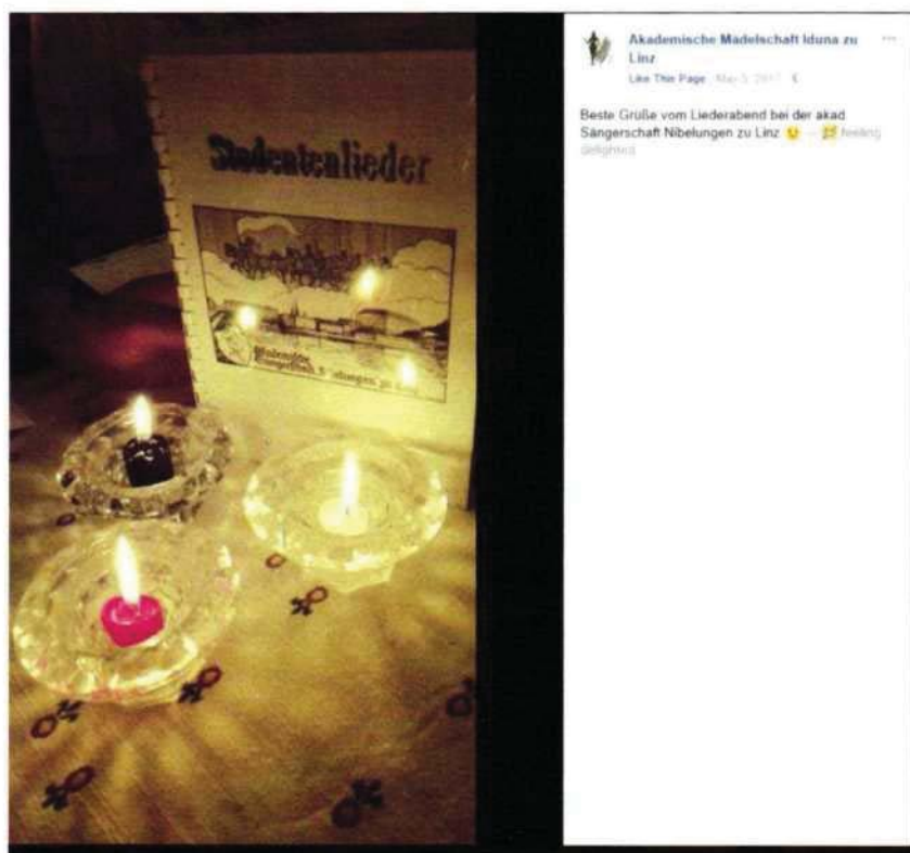
Abbildung 12