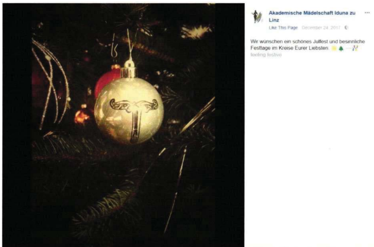
Abbildung 4 | Quelle:

Außerdem feiert Mädelschaft Iduna am 24. Dezember offenbar das „Julfest“ vi , wie auch der Screenshot zeigt.: ein Code für Neonazis und Rechtsextreme, die Weihnachten von germanischen Julfest ableiten um keine christlichen Bräuche zu bedienen. Denn schon die Nationalsozialisten hatten versucht, Weihnachten umzudeuten vii . Auch die Sonnwendfeier begehen die rechten Iduna-Mitglieder. In Deutschland rufen Rechtsextreme immer wieder zu „Sonnwendfeiern“ auf viii .