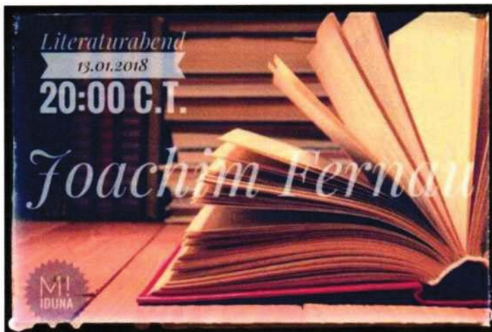
Abbildung 15 | Quelle:

Fragen, Antworten, Interpretationen und Diskussionen dazu gibt es am 13.01.2018. 😊