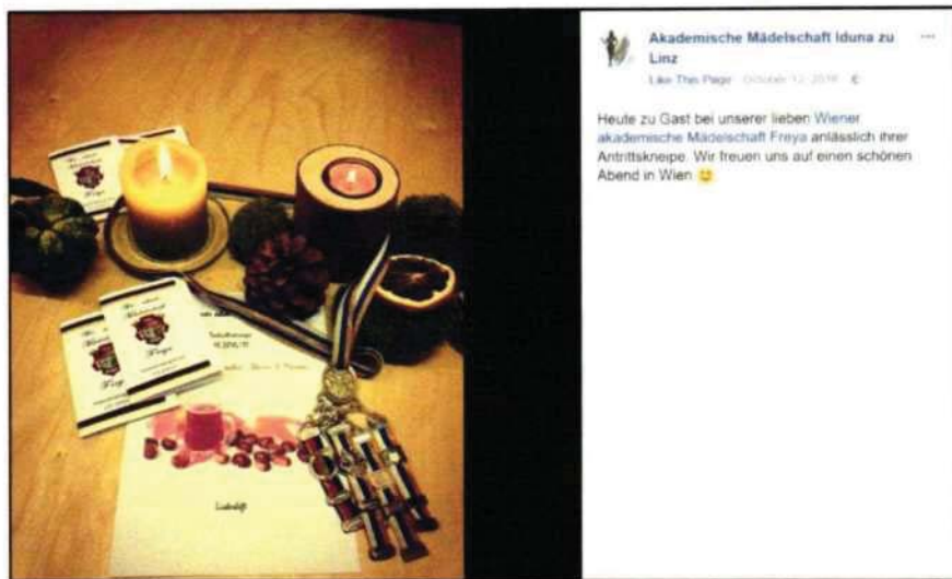
Abbildung 11