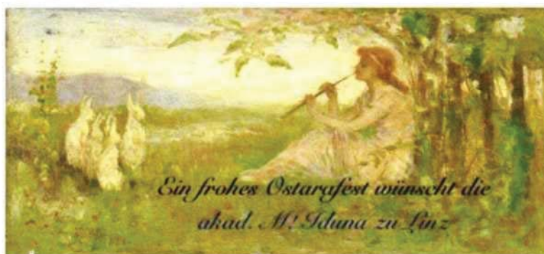
Abbildung 13 | Quelle:

Grüner Schimmer spielt wieder Drüben über Wies' und Feld. Frohe Hoffnung senkt sich nieder Auf die stumme trübe Welt. Ja, nach langen Winterleiden Kehrt der Frühling uns zurück, Will die Welt in Freude kleiden, Will uns bringen neues Glück. Hoffmann von Fallersleben