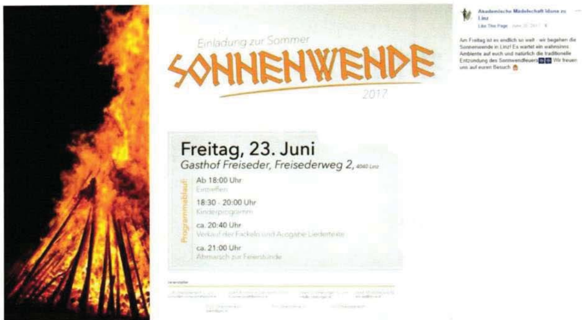
Abbildung 7