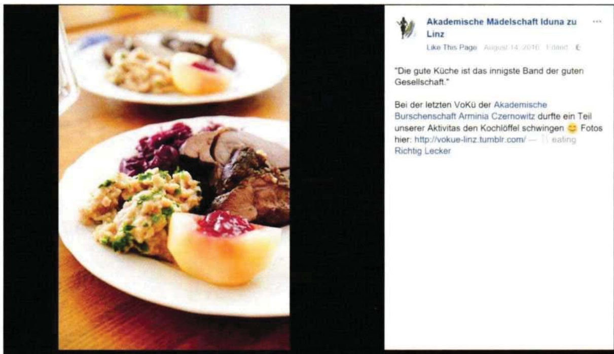
Abbildung 10