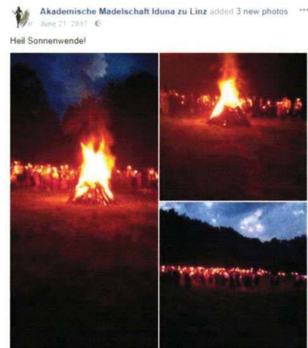
Abbildung 6

https://www.facebook.com/iduna.linz/photos/a.631068920252352.1073741829.621014437924467/2163184610374101/?type=3&theater (abgerufen am 4.1.2018)