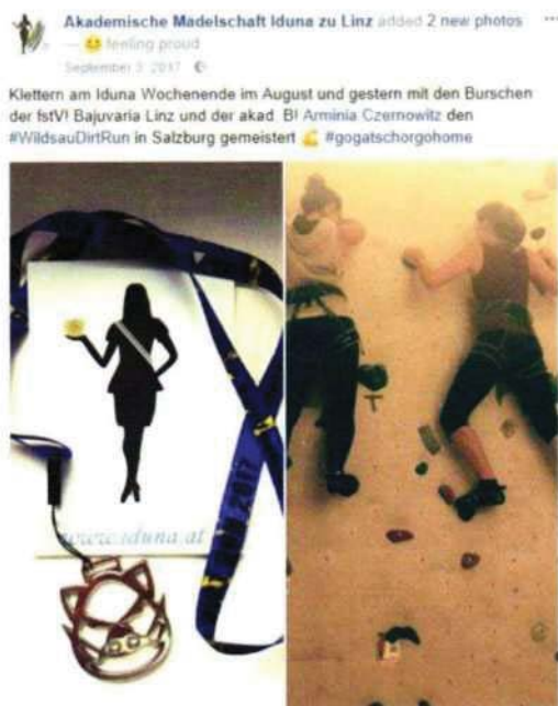
Abbildung 9

Enge Verbindungen pflegt die Mädelschaft Iduna zur Linzer Burschenschaft „Arminia-Czernowitz“ x . Am 3. September 2017 postete die Facebookseite der Mädelschaft, man habe den „WildsauDirtRun“ unter anderem mit den Burschen der akademischen Burschenschaft „Arminia-Czernowitz“ absolviert (s.u.). Am 14. August wurde veröffentlicht, einige Aktivistinnen der Mädelschaft hätten an der „Vokü“ (Volksküche, Anm.) der Burschenschaft Arminia-Czernowitz teilgenommen.